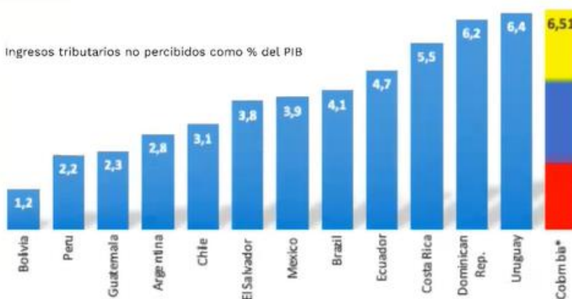
Ingresos tributarios no percibidos como % del PIB