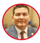
Rep. Hugo Archila Partido Liberal Casare