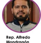
Rep. Alfredo Mondragón Partido Polo Democrático Valle del Cauca