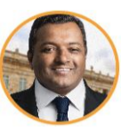
Rep. Víctor Salcedo Partido de la U Valle del Cauca