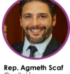
Rep. Agneth Scaf Coalición Coalición Pacto Histórico Atlántico