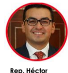
Rep. Héctor Chaparro Partido Liberal Boyacá