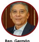
Rep. Germán Gómez Partido Comunes Atlántico