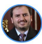
Rep. Andrés Forero Partido Centro Democrático Bogotá