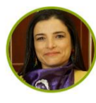
Rep. Martha Alfonso Coalición Pacto Histórico-(A, Verde) Bogotá