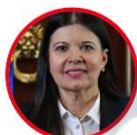
Rep. Flora Perdomo Partido Liberal Huila