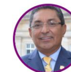
Rep. Modesto Aguilera Cambio Radical Atlántico