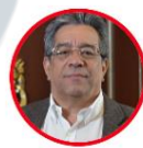
Rep. Dolcey Torres Partido Liberal Atlántico