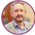
Rep. Pedro Suárez Pacto Histórico Boyacá