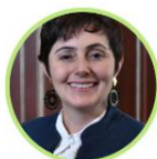
Rep. Carolina Giraldo Alternativos Risaralda