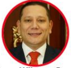
Rep. Wilmer Guerrero Partido Liberal Norte de Santander