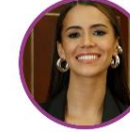
Rep. María Carrascal Pacto Histórico Bogotá