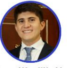
Rep. Wadith Manzur Partido Conservador Córdoba