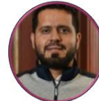
Rep. Alfredo Mondragón Pacto Histórico Valle del Cauca