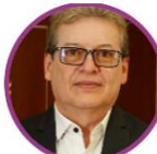
Rep. Alirio Uribe Pacto Histórico Bogotá