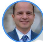
Rep. Juan Espinal Centro Democrático Antioquia