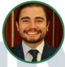
Rep. Santiago Osorio Alianza Verde Caldas