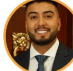
Rep. Diego Caicedo Partido de la U Cundinamarca