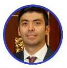
Rep. Nicolás Barguil Partido Conservador Córdoba