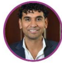
Rep. David Racero Pacto Histórico Bogotá