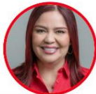
Rep. Karyme Cotes Partido Liberal Sucre