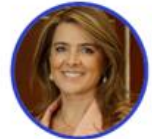
Rep. Juana Londoño Partido Conservador Caldas