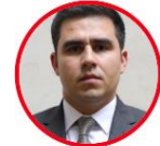
Rep. Carlos Ardila Partido Liberal Putumayo