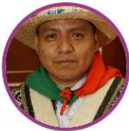
Rep. Ernes Pete Pacto Histórico Cauca