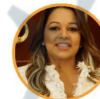
Rep. Ana García Partido de la U Córdoba