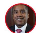
Rep. Alberto Palacios Partido Liberal Chocó