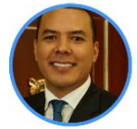
Rep. Edinson Olaya Centro Democrático Casanare