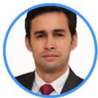
Rep. José Uscátegui Centro Democrático Bogotá