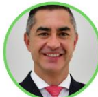
Rep. Wilder Escobar Gente en Movimiento Caldas