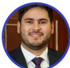
Rep. Andrés Montes Partido Conservador Bolívar