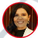
Rep. Jezmi Barraza Partido Liberal Atlántico