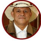
Rep. Pedro García Comunes Antioquia