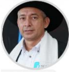
Rep. William Aljure CITREP