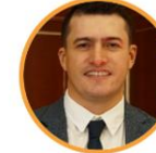
Rep. Álvaro Londoño Partido de la U Vichada