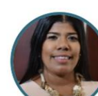
Rep. Ana Monsalve Vamos Juntos Circunscripción Especial por Comunidades Afrocolombianas en Atlántico