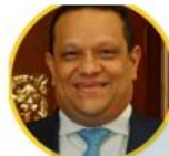
Rep. Jorge Cerchiaro Colombia Renaciente Guajira