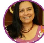
Rep. Carmen Ramírez Pacto Histórico Circunscripción Internacional