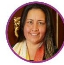
Rep. Etna Argote Pacto Histórico Bolívar