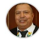
Rep. Haiver Rincón CITREP