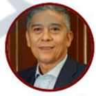
Rep. Germán Gómez Comunes Atlántico