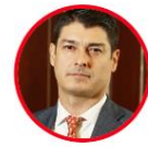
Rep. Leonardo Gallego Partido Liberal Valle del Cauca