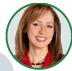
Rep. Olga Velásquez Alianza Verde Bogotá