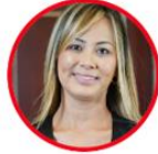
Rep. Mónica Bocanegra Partido Liberal Amazonas