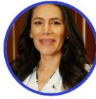
Rep. Esperanza Isaza Partido Conservador Tolima