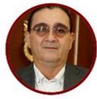
Rep. Jairo Cala Comunes Santander