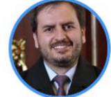
Rep. Andrés Forero Centro Democrático Bogotá