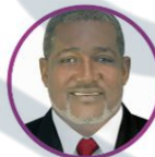
Rep. Cristóbal Caicedo Pacto Histórico Valle del Cauca