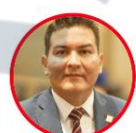
Rep. Hugo Archila Partido Liberal Casanare