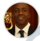
Rep. Gerson Montaña CITREP