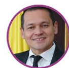
Rep. Jorge Ocampo Pacto Histórico Valle del Cauca