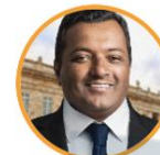
Rep. Víctor Salcedo Partido de la U Valle del Cauca