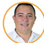
Rep. Camilo Ávila Partido de la U Vaupés