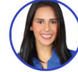
Rep. Ángela Vergara Partido Conservador Bolívar