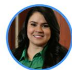
Rep. Yulieth Sánchez Centro Democrático Antioquia