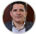
Rep. Juan Vargas CITREP