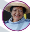
Rep. Leyla Rincón Pacto Histórico Huila