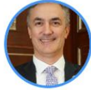
Rep. Christian Garcés Centro Democrático Valle del Cauca