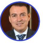
Rep. Héctor Cuéllar Partido Conservador Caquetá