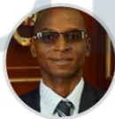
Rep. Orlando Castillo CITREP