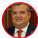
Rep. Álvaro Monedero Partido Liberal Valle del Cauca