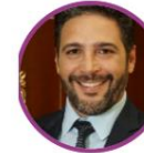
Rep. Agmeth Escaf Pacto Histórico Atlántico