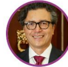
Rep. Heraclito Landinez Pacto Histórico Bogotá