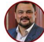
Rep. Carlos Carreño Comunes Bogotá