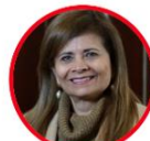
Rep. Piedad Correal Partido Liberal Quindío