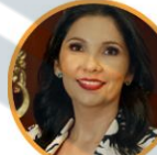
Rep. Milene Jarava Partido de la U Sucre