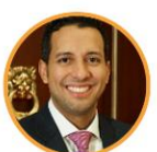
Rep. Julián López Partido de la U Valle del Cauca