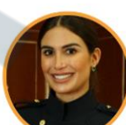
Rep. Saray Robayo Partido de la U Córdoba