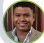
Rep. Miguel Polo Polo Circ. Esp. Com. Afro, Raíces y Palenqueras