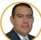
Rep. Wilmer Carrillo Partido de la U Norte de Santander