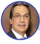
Rep. Armando Zabarain Partido Conservador Atlántico