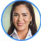
Rep. Yenica Acosta Centro Democrático Amazonas