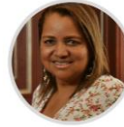
Rep. Leonor Palencia CITREP