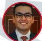
Rep. Héctor Chaparro Partido Liberal Boyacá