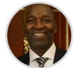
Rep. James Mosquera CITREP