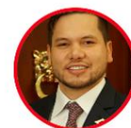
Rep. Andrés Calle Partido Liberal Córdoba