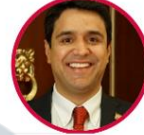
Rep. Carlos Quintero Partido Liberal Cesar