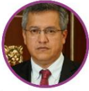
Rep. Jorge Bastidas Pacto Histórico Cauca