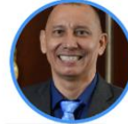
Rep. Hugo Lozano Centro Democrático Vaupés