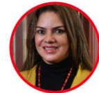
Rep. Gilma Díaz Partido Liberal Caquetá