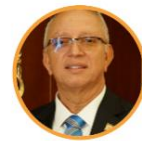
Rep. Jorge Tamayo Partido de la U Valle del Cauca