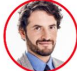
Rep. Juan Lozada Partido Liberal Bogotá