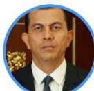
Rep. Carlos Osorio Centro Democrático Tolima