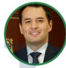
Rep. Wilmer Castellanos Alianza Verde Boyacá