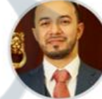
Rep. Diógenes Quintero CITREP