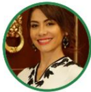
Rep. Catherine Juvinao Alianza Verde Bogotá